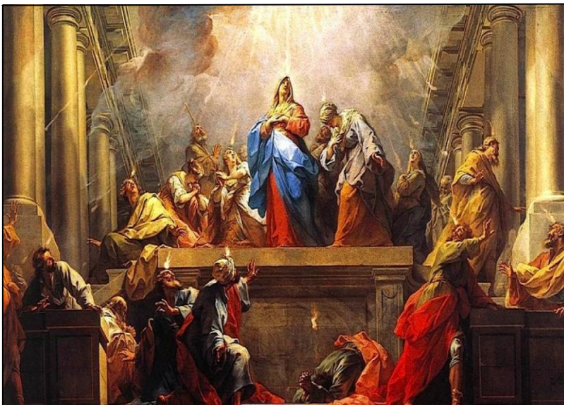
Πεντηκοστή, η κάθοδος του Αγίου Πνεύματος

Έχεις εσύ αυτή την αίσθηση της καθοδήγησής Του;