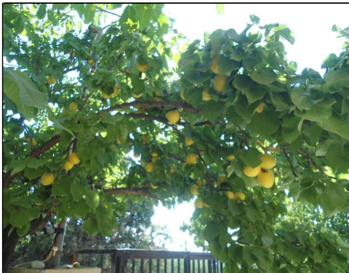
Κάθε δένδρο από τον καρπό του γνωρίζεται

Αυτό είναι το μυστικό της καρποφορίας. “Χωρίς Εμένα δεν μπορείτε να κάνετε τίποτα” μας λέει και σήμερα ο Χριστός. Μόνο όταν έλθετε και μένετε ενωμένοι μαζί μου θα έχετε καρπό που να μένει. “Εάν θέλετε και υπακούσετε θα φάτε τα αγαθά της γης” (Ησ. 1:19).