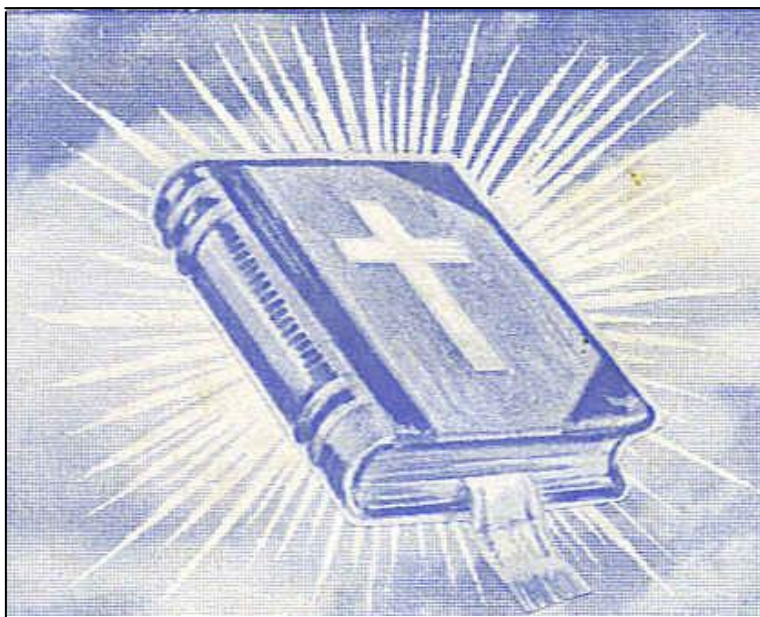
Λογνάρι στα πόδια μου είναι ο Λόγος Σου (Ψαλμ. 119:105)

γία Γραφή. Κι αυτό διότι, «Όλη η Αγία Γραφή είναι θεόπνευστη και ωφέλιμη για διδασκαλία, για έλεγχο, για επανόρθωση, για διαπαιδαγώγηση με δικαιοσύνη, δια να είναι τέλειος ο άνθρωπος του Θεού, καταρτισμένος για κάθε έργο καλό» (Β΄ Τιμ. 3:16, 17).